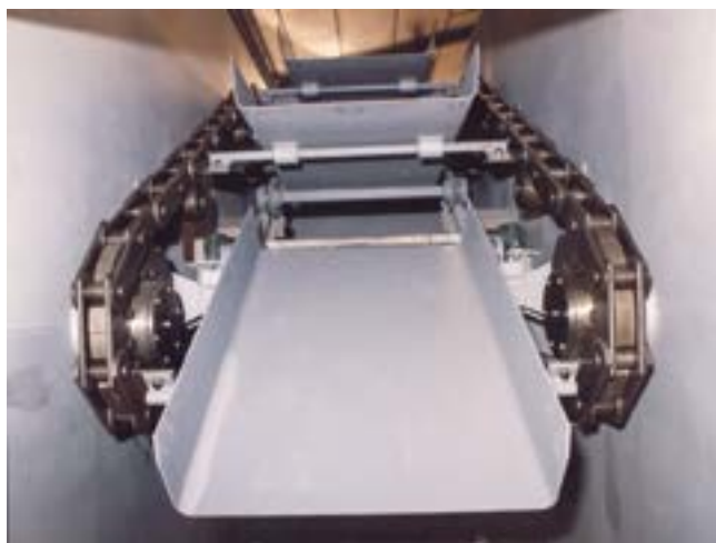
Vassoi abbattibili Folding trays Bandejas abatibles